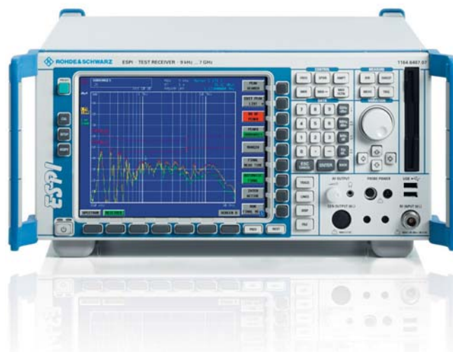
Измерительный приемник R&S®ESPI 3